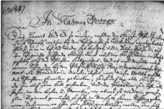
Ausschnitt von der ersten Seite des Kaufvertrages