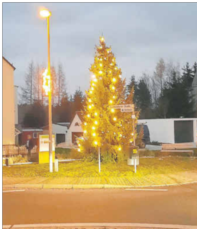
Der Jahnsdorfer Weihnachtsbaum