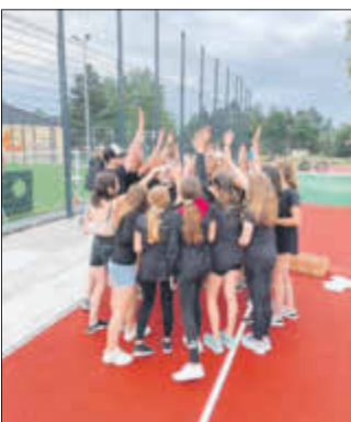
Wir sind ein Team

Am 24.06.22 ging es im Ev. Schulzentrum Leukersdorf sportlich und feierlich zu.