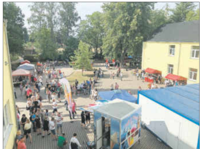
Sommerfest von oben

Im Anschluss an den Sponsorenlauf fand bei strahlendem Sonnenschein nach zwei Jahren Corona-Pause erstmals wieder eine gut besuchte, öffentliche Veranstaltung statt: Das Sommerfest. Zahlreiche Stände boten nicht nur kulinarische Köstlichkeiten an, sondern auch Spaß und Unterhaltung. So konnte man beispielsweise erneut seine sportlichen Fähigkeiten beim Schubkarrenrennen oder beim Fußball-Parcours unter Beweis stellen oder witzige Fotos mit verschiedenen Kostümen machen, die sofort ausgedruckt und mitgenommen werden konnten. Außerdem diente die kleine Treppe zur Turnhalle mit Vordach als Bühne, auf der verschiedene musikalische Beiträge präsentiert wurden. Sogar die Feuerwehr rückte an, wenn auch nicht im Einsatz!