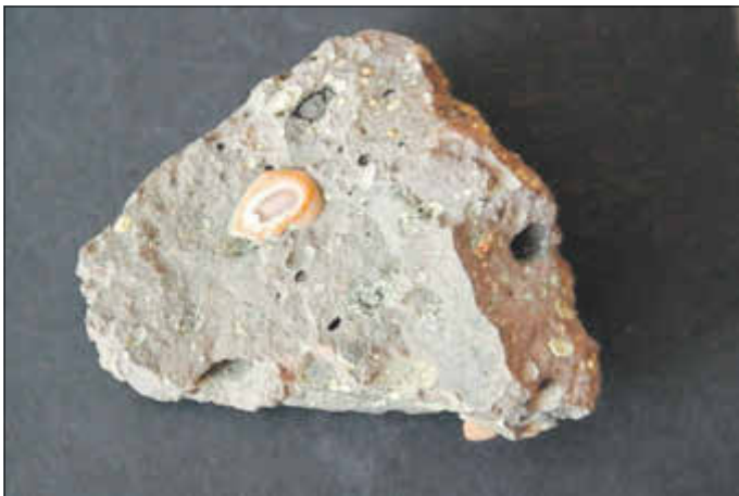
Melaphyr - Mandelstein Steinberg Steegenwald, Foto: G. Gränitz

Wie immer mit kurzer Eröffnung und gemeinsamen Beisammensein bei Kaffee und Kuchen in der Heimatstube Neue Gasse 8.