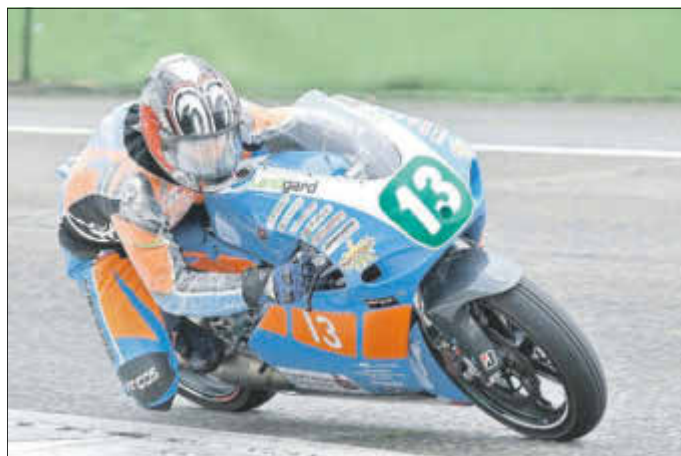
Marcel Becker gibt der 250er Yamaha die Sporen