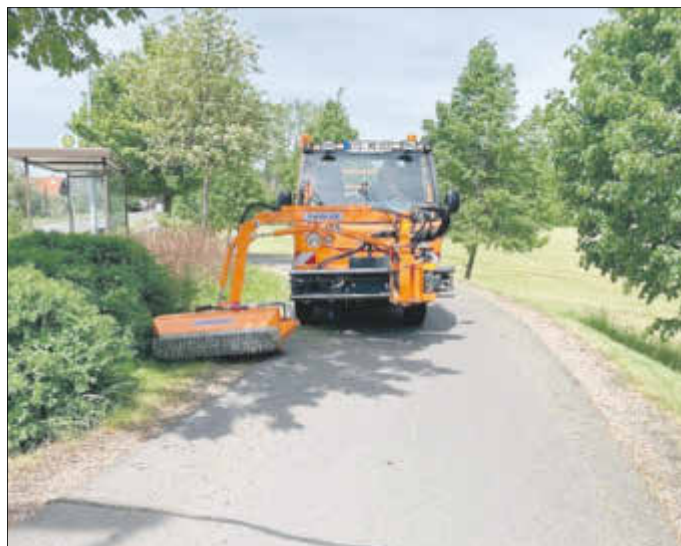
Albrecht Spindler Bürgermeister

Neben den Baumaßnahmen sind die Mitarbeiter des Bauhofes seit April mit der Grasmahd im Gemeindegebiet und den Objekten beschäftigt. Erleichterung bringt das neue Schlegelmähwerk, welches für den Bauhof durch die Gemeinde angeschafft wurde, dass in Kombination mit dem Multicar für die Grasmahd an Banketten und Straßenrändern eingesetzt wird. Dadurch wird die Pflege des Straßenbegleitgrüns effektiver.