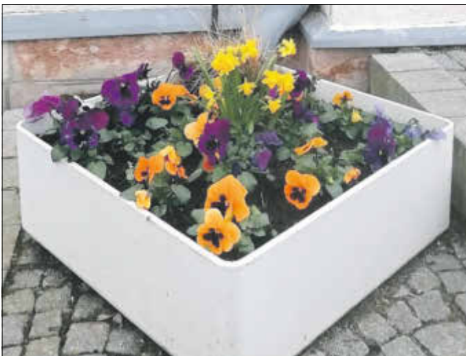
Es blüht vor der Grundschule