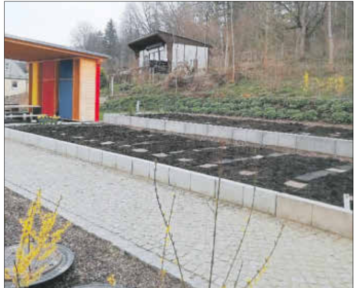
Die Klasse 4a hat fleißig die Terrassenbeete für den Schulgarten vorbereitet. Jetzt muss nur noch das Saatgut in die Erde, die Kartoffeln und Zwiebeln müssen gesteckt werden.