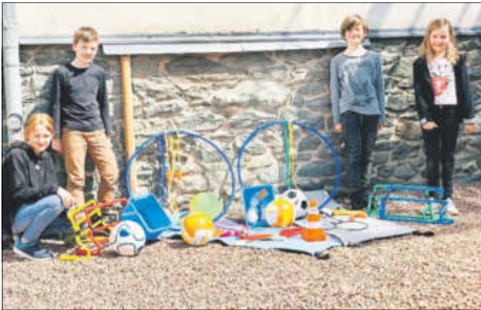
Hortkinderrat der 4. Klassen

Nach Lieferverzögerungen beim Osterhasen freuen sich die Hortkinder nun über neue Fuß- und Volleybälle, Reifen, Seile, Hürden, Tischtennisschläger, Kegel und vieles mehr. Dafür danken wir unserem Elternbeirat, der wahrscheinlich einen guten Draht zum Osterhasen hat.