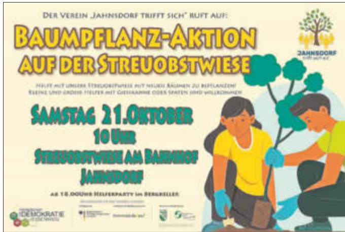
Jahnsdorf trifft sich e.V.

Für alle Fleißigen gibt es dann ab 18 Uhr eine kleine Helferparty im Bergkeller Jahnsdorf, dort sollen Pläne für die Mithilfe entstehen. Für Essen, Getränke und Musik sorgen wir.