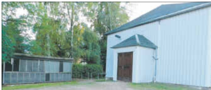
„Alte Turnhalle mit Käfiglager“ links: ehemals Edeka rechts: Lagerschuppen Verein Neukirchen

Anfangs des Jahres 1998 erhielten wir die Ausstellungskäfige und Tombolabude vom aufgelösten Verein Neukirchen. Mitte des Jahres kam dann noch die Verkaufsbude vom EDEKA-Markt dazu. Beide Schuppen wurden an der „Alten Turnhalle“ aufgestellt und dienen bis heute als Lager für unsere Ausstellungskäfige. Das Jahr sollte auch das letzte werden, wo wir mit unseren Tieren nach Veitsbronn zur Jungtierschau reisten. Die Scheune wurde nach der Schau abgerissen, um einem neuem Ärztehaus Platz zu machen.