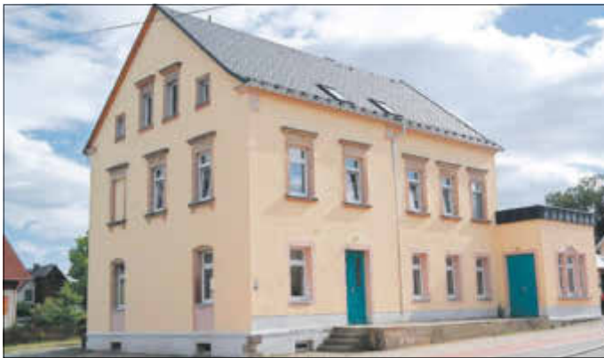
Neue Gasse 8 - Im Erdgeschoss befindet sich unsere Heimatstube

Wir beginnen als erstes mit dem Thema „Friedliche Revolution und 30 Jahre Wiedervereinigung“. Im Januar folgt eine Ausstellung zum Thema „Inflation in Deutschland“. Wer weitere Vorschläge oder Ideen zu interessanten Themen hat, kann sich jeder Zeit bei uns melden!