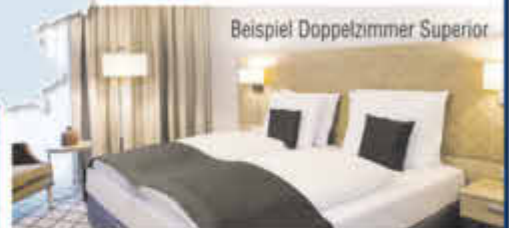
Beispiel Doppelzimmer Superior