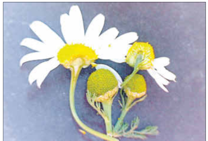
Abbildung: Blüten von Hundskamille (links), Strahlenloser Kamille (mitte) und Echter Kamille (rechts). Letztere ist innen hohl.

Geht man im Sommer die Wege zwischen unseren Orten entlang, kann man mit einiger Aufmerksamkeit drei Kamillen-Arten am Feldrain der Getreidefelder finden. Eigentlich nur zwei. Die Echte Kamille und die Strahlenlose Kamille sind „wirkliche“ Kamillen der Gattung Matricaria . Während die Echte Kamille den wissenschaftlichen Namen Matricaria chamomilla trägt, heißt die Strahlenlose Kamille Matricaria discoidea . Dann gibt es noch die Kamille, die keine ist. Die Hundskamille Anthemis arvensis sieht zwar aus wie eine Kamille, gehört jedoch in der Pflanzensystematik in eine andere Gattung. Wichtigstes Merkmal der beiden „richtigen“ Kamillen ist der typische aromatische Kamillengeruch. Den besitzt auch die Strahlenlose Kamille; sie hat jedoch keine weißen Blütenblätter. Die haben die Echte Kamille und die Hundskamille. Woran unterscheidet man diese nun? Zuerst am Geruch; die Hundskamille hat einen dumpfen, etwas unangenehmen Geruch. Ist man sich nicht sicher, sollte man sich eine Blüte genauer anschauen. Wird sie vorsichtig in der Mitte geteilt, besitzt die Echte Kamille einen Hohlraum über dem Blütenboden. Die Hundskamille ist innen ganz gefüllt.