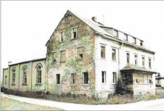
Das Bild zeigt den Zustand kurz vor dem Abriss. In den 80er-Jahren war der äußere Zustand ähnlich, nur die Fensterscheiben waren noch nahezu alle in Ordnung.