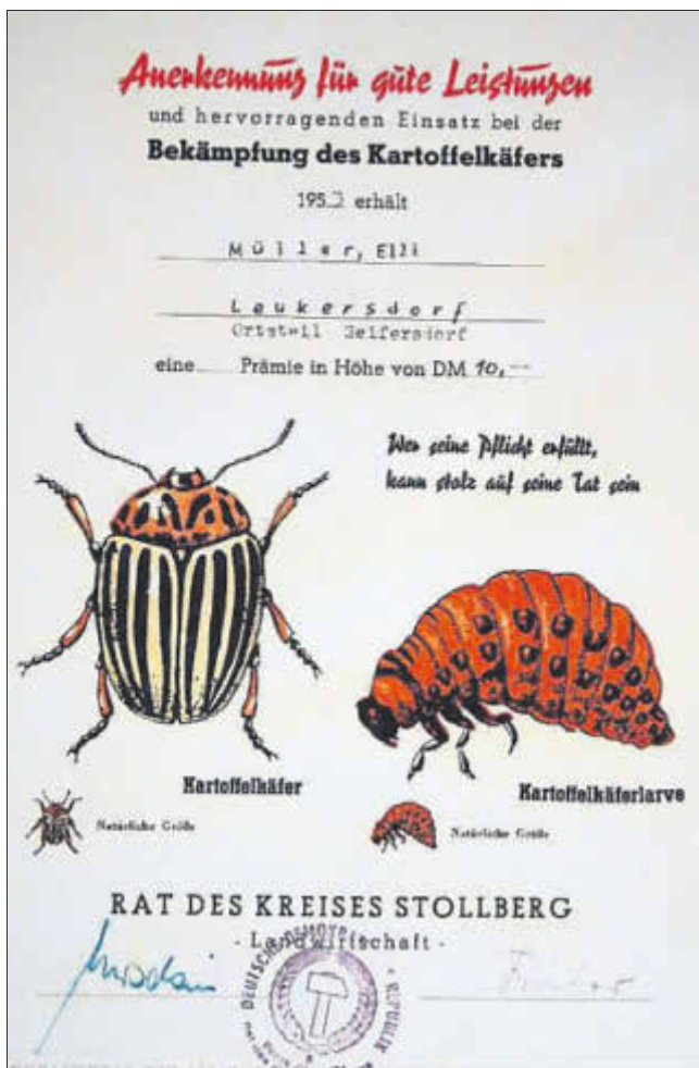
Urkunde von 1953

Weiter wird geschrieben: „Gefundene Tiere dürfen auf keinen Fall in einer Schachtel mitgenommen oder lebend herumgetragen werden.“ Um das zu verhindern, sind hohe Geldstrafen und Gefängnisstrafen bis zu anderthalb Jahren ausgesetzt worden. Damals hat man auch die „chemische Keule“ eingesetzt. Die Felder wurden vier Wochen lang wöchentlich einmal mit Kalkarsen gespritzt oder mit Gesarol bestäubt. Ich kann mich noch daran erinnern, dass in den 50er Jahren Einsätze zur Bekämpfung der Käfer von den Schulen organisiert wurden. In diesen Jahren war fast die Hälfte der Kartoffelfelder in der DDR befallen. Aus Seifersdorf existiert eine Urkunde von 1953, die als Anerkennung für gute Leistung bei der Käferbekämpfung verliehen wurde. Die Besitzerin der Urkunde erhielt damals eine Prämie von 10 DM.