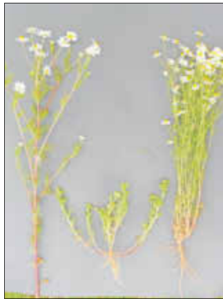
Abbildung: Hundskamille (links), Strahlenlose Kamille (mitte) und Echte Kamille (rechts).

Alle Pflanzen wurden am gleichen Standort gesammelt. Und dann gibt es noch eine, die auch keine Kamille ist. Diese findet man in allerjüngster Zeit auf den Blühflächen, die jetzt überall an den Äckern angelegt werden. Die Färber Hundskamille ( Anthemis tinctoria ) ist, wie es der Name sagt, mit der Acker-Hundskamille verwandt. Ihre auffällig gelben Blüten zieren die blütenreichen Flächen. Früher wurden die Farbstoffe der Pflanze zum Färben von Wolle und Leinen verwendet. Dieses traditionelle Handwerk wird in manchen Gegenden auch heute noch durchgeführt.