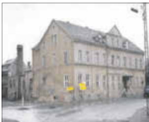
Gasthof „Grüne Aue“

Dazu wurden durch den Kreisverband der Erfüllungsstand des „Volkswirtschaftsplanes“ der Sparte und der Stand der Schadholzbeseitigung im Forst durch die Mitglieder der Sparte abgefordert. Eine geplante Ausfahrt musste wegen Busmangel abgesagt werden. Dafür führte man ein zünftiges Sauschlachten durch. Zur Bezirksschau in Karl-Marx-Stadt wurden 50 Tiere gemeldet. Im folgenden Jahr gab es einigen Unmut bei den Mitgliedern. Auf die Bezugsscheine für Futter, welche man bei der Fellabgabe erhielt, erhielt man kein Körnerfutter mehr, sondern nur noch die minderwertige Kleie. Ausgerüstet mit Säge, Beil und Axt gingen die Mitglieder am 30. Mai 1981 in die Bruchholzaktion. Die DDR Siegerschau fand in Leipzig Markleeberg am 28./29.11.1981 mit 7000 Tieren. An ihr nahmen gelegentlich die Zuchtfreunde Max Lasch aus Seifersdorf mit den Holländer schwarz-weiß und Frank Hofmann mit den Kleinsilbern gelb teil. Im Jahr 1981 wurden die Baumaßnahmen in der Schule mit der Einweihung der neuen Turnhalle abgeschlossen. Unser Ausstellungslokal „Alte Turnhalle“ wurde an den Sport übergeben. Dadurch hatten wir bei der Terminwahl für Ausstellungen mehr Möglichkeiten. Der Geflügelverein und unser Verein wurden 1981 in die Nationale Front integriert. Hierdurch gab es dann Möglichkeit, Pokale für unsere Schauen zu bekommen.