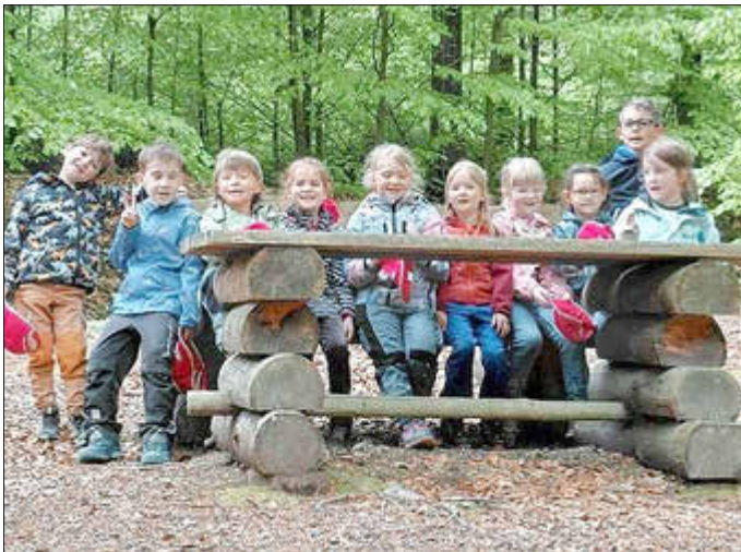
Bis bald sagen die Kinder und das Team der Kita Bienenkorb aus Leukersdorf