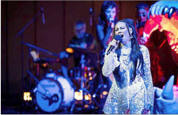
Split Tooth: Saputjiji Tanya Tagaq Donnerstag, 18. Juni

So wird das Festival zu einem Ort, an dem sich Kulturen begegnen und neue Perspektiven entstehen. Aber: schnell sein lohnt sich, da die Aufführungen nur zeitlich begrenzt und mit limitierter Platzzahl stattfinden. Alle Infos unter: www.theaterderwelt.de – einzelne Programmzeitschriften liegen auch im Rathaus aus.