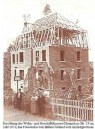
Strukturierung des Wohn- und Geschäftshauses Chremnitz Nr. 23 im Jahr 1918. Das Fotostudio von Hähnel befand sich im Erdgeschoss

In den späteren Jahren begnügte man sich dann mit einer Stempelprägung auf dem Foto.