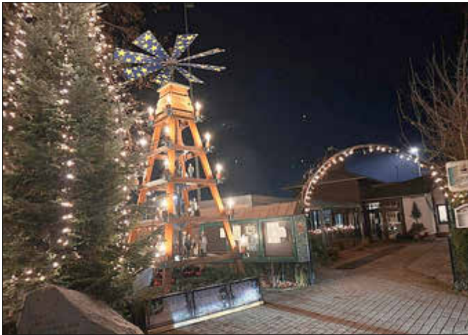
Abbildung: Freilandpyramide Foto: Th. Gruner

Pünktlich zum ersten Advent fand das traditionelle Pyramide-Anschieben an der Sportgaststätte statt. Das Wetter meinte es nicht allzu gut mit uns, nicht desto trotz waren auch diesmal wieder sehr viele anwesend. Der Heimatverein hat für das leibliche Wohl gesorgt und die Schützengesellschaft Leukersdorf für den entsprechenden Rahmen. Gleichzeitig wurde auch die neue Freilandpyramide, die in kurzer Zeit, unter Leitung von Detlef Voigt mit einigen fleißigen Helfern entstand, eingeweiht. Sie kann sich wirklich sehen lassen. Im Anschluss gab es in der Sportgaststätte noch einen zünftigen Hutzenabend.